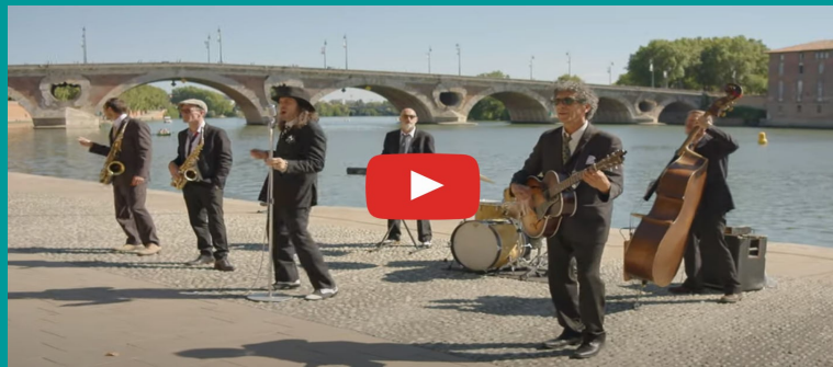
Clip sur les bords de Garonne: «Make me happy!», 2022