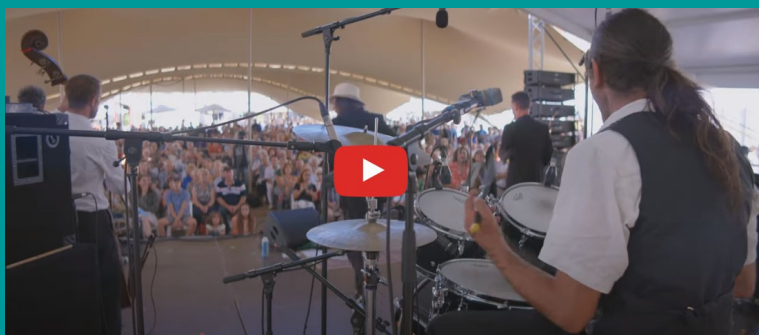
Live in Marciac 2023: «Hot dog for my baby»